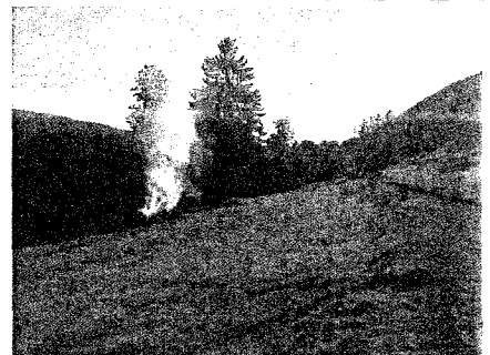
Exemple de feu illicite (élimination de bois frais en septembre, zone agricole à proximité d'une lisière de forêt et d'une desserte).